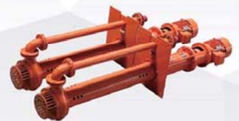
Submersible Slurry Pump