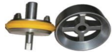
Supreme valve and seat