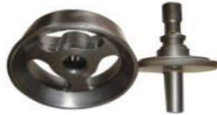
Standard Plate type valve