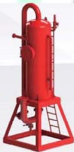
Mud Gas Separator