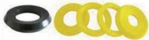
Polyurethane valve inserts