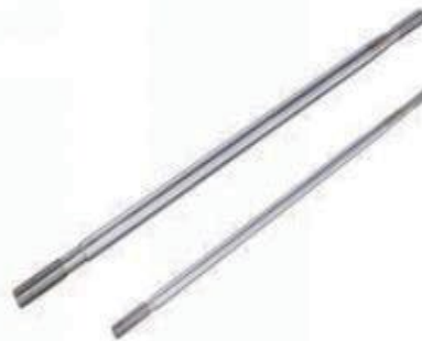
Duplex Piston rod