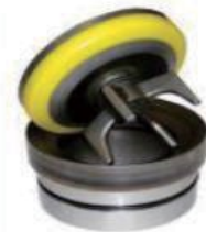
Service master valves