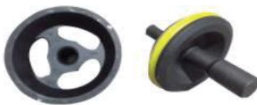
Double angle O ring valve