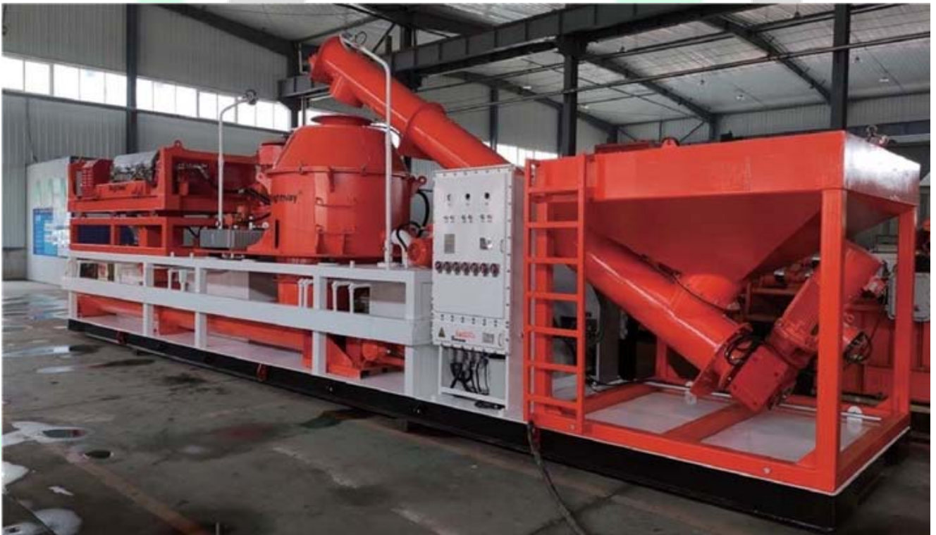
Drilling Waste Management System