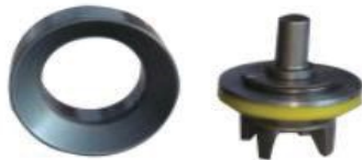
G2 Full open valves