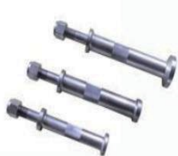
Triplex piston rods & nuts

RPS offers a full line of piston rods, extension rods, sub rods and clamps to triplex and duplex mud pump.