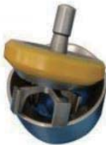
Southwest style valves