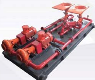
Jet Mud Mixer