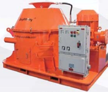
Vertical Cutting Dryer